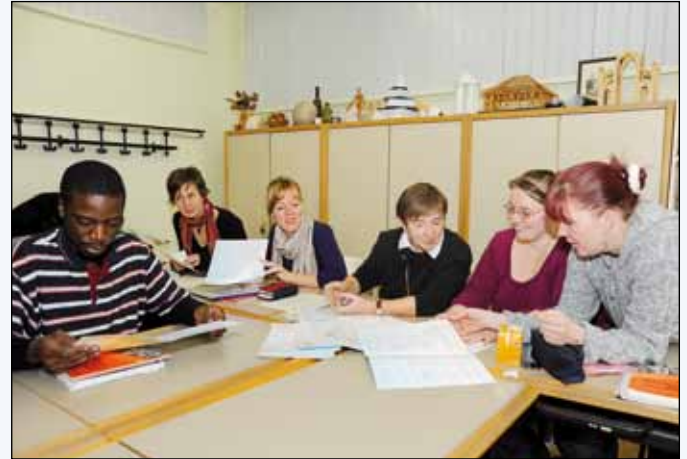
Auswertung der Meinungsumfrage im „Victor-Klemperer-Kolleg“

ßerte aber die Absicht, demnächst einen Wohnungswechsel vornehmen zu wollen.